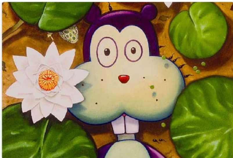
El gato Frank

En las notas interiores de esta excelente edición especial, Neal Adams comenta que este puede ser el mejor cómic de siempre. La realidad es bien distinta, pero durante muchos años "Superman vs. Muhammad Ali" sí que fue una preciadísima pieza de coleccionista: los dos superhombres luchan en el espacio para salvar la Tierra de unos alienígenas cabreados, y entre el público puede verse a The Jackson 5, Batman y Frank Sinatra. ¿Quién dijo kitsch? L.J.M.